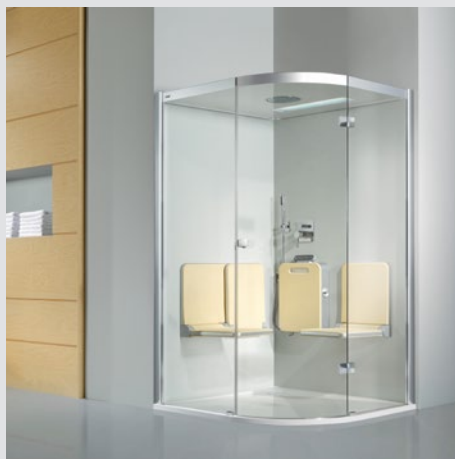
Artweger Dampfdusche BODY+SOUL