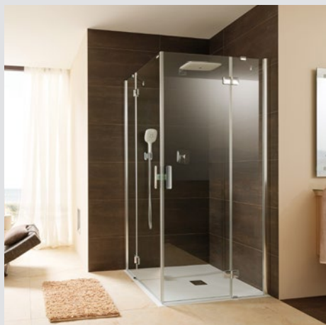
Artweger Duschabtrennungen Vielfältige Lösungen