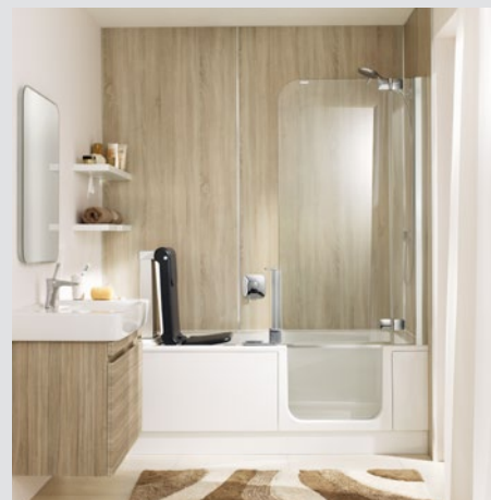
Artweger Duschbadewanne TWINLINE und ARTLIFT