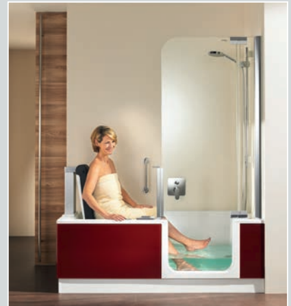
Douche-baignoires Artweger TWINLINE & ARTLIFT