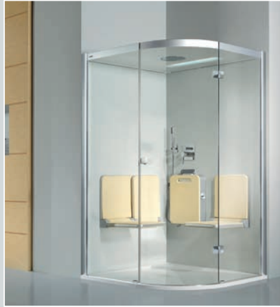
Douche hammam Artweger BODY+SOUL