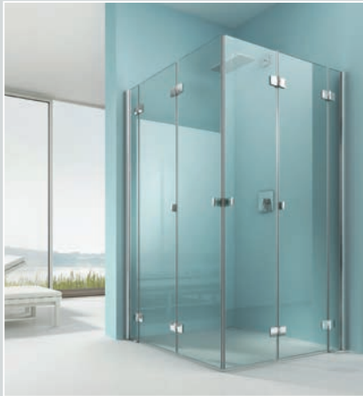
Ecrans de douche Artweger en verre naturel